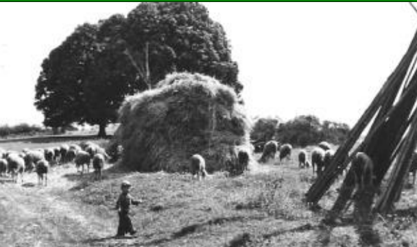
Die Schafherde und Heuschöber im Vordergrund. Hinten im Bild Die Drei Linden Ende der 1960er Jahre